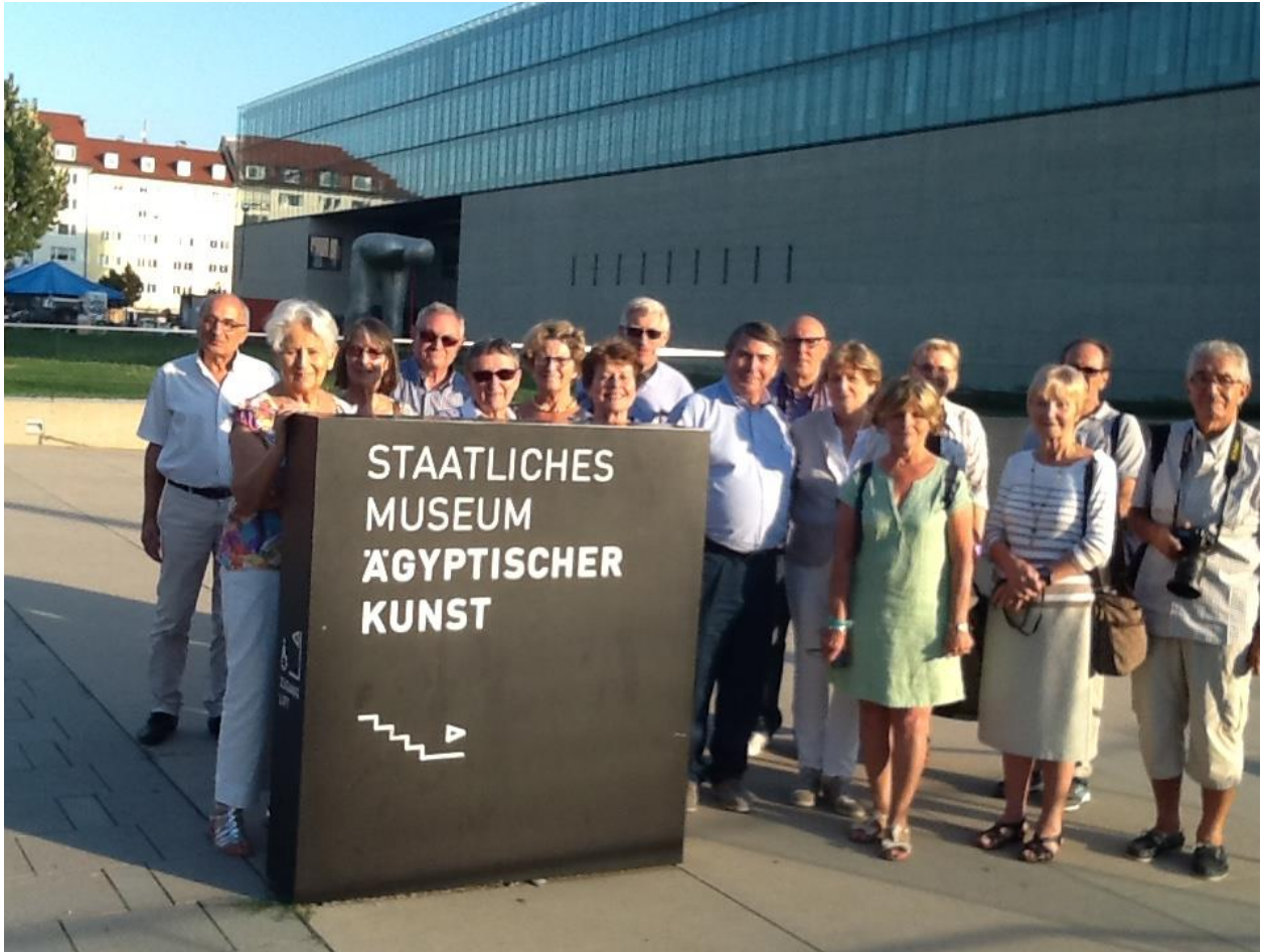
Et ... la photo qui n'existe que grâce à Photoshop et son utilisateur, JC Duveau !